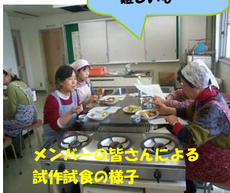
メンバーの皆さんによる 試作試食の様子