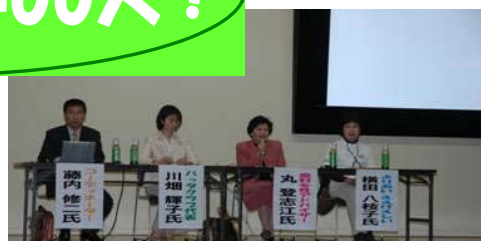
健康づくりシンポジウム 健康づくりでキラッと光る人紹介