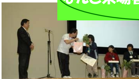
健康づくりキャンペーン表彰式